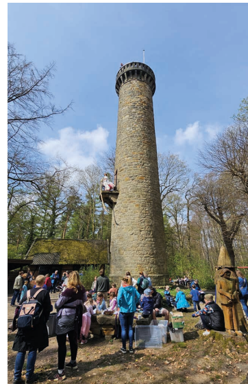
Für Essen & Trinken sorgt das Team des Wilhelmsturm!

Alle Kinder, die als Rapunzel, als Prinzessin oder Prinz gekleidet beim Wilhelmsturm erscheinen, erhalten eine Überraschung!