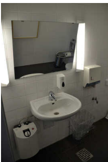
WC für Menschen mit Behinderung