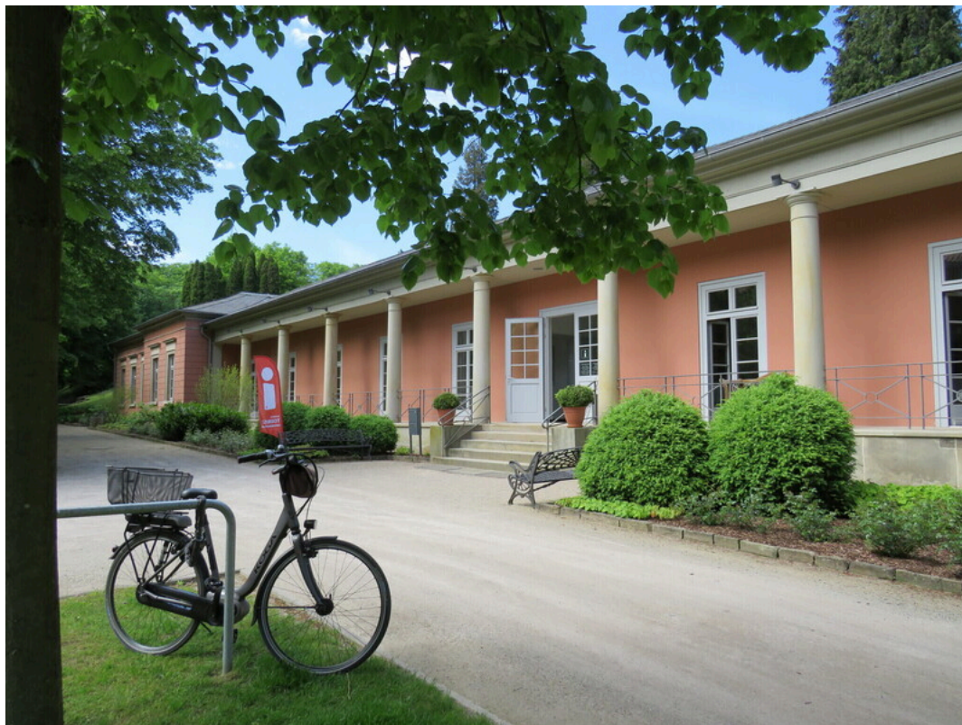
Tourist-Information Rehburg-Loccum