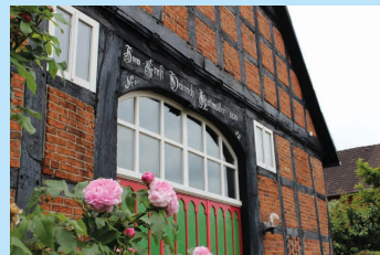
Bauernhaus in Winzlar