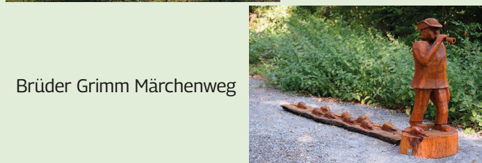
Brüder Grimm Märchenweg