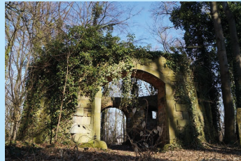
Alte Mühle in Rehburg