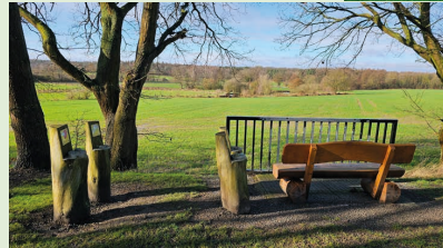
Ausblick an der Schwarzen Brücke