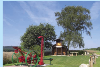
Haarberg in Winzlar